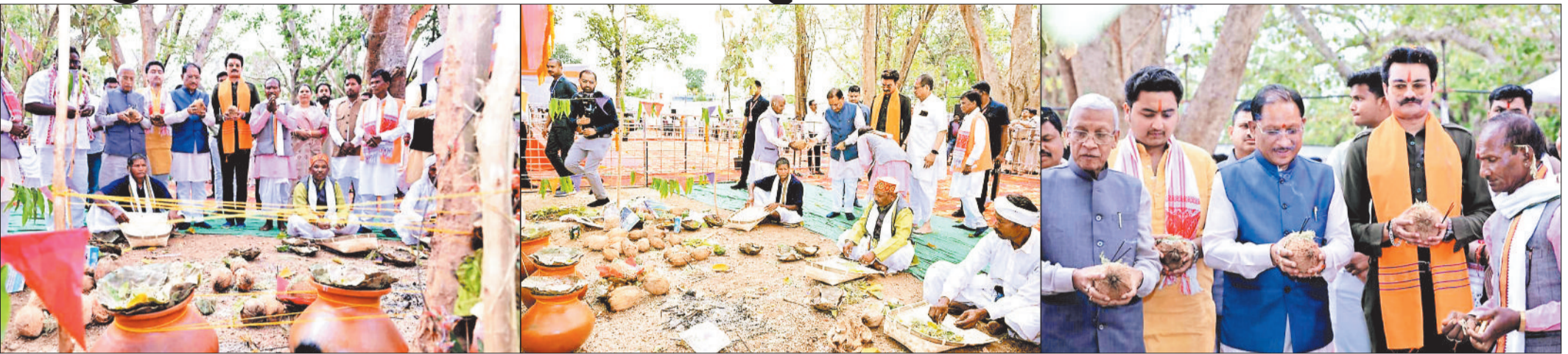
हरिभूमि न्यूज | जशपुरनगर

सरहुल नृत्य प्रस्तुत किया। वहीं मांदर की थाप पर पूरा परिसर उत्साह और उल्लास से झूम उठा।