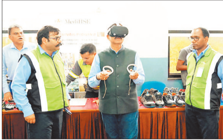
तकनीकी बारीकियों का जायजा लेते अधिकारी।

इस अवसर पर उन्होंने सभी कर्मचारियों द्वारा निरंतर सुरक्षा मानकों के पालन के लिए